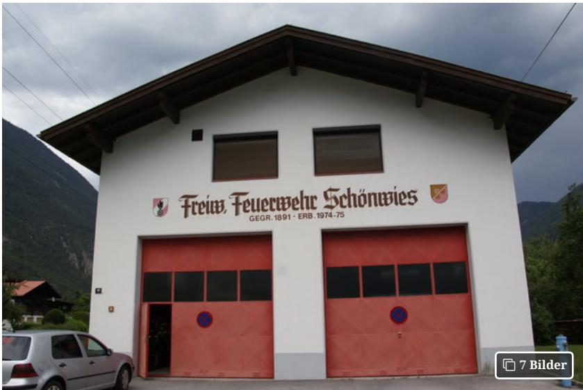
In der Endlos-Diskussion um den Neubau der Feuerwehrrhalle kommt nun Schwung.